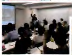
「美容と経営プラン」に掲載されました!

「紙とペン」だけで お客様が溢れる! 高単価メニューも 店販も売れる! 先輩だけに 人気のヒミツ 教えちゃいます!!